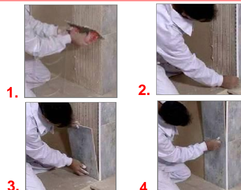
Exemple de mis en œuvre du modèle Novocanto ®

Cette finition est obtenue grâce à des rubans ou brosses de polissage. Il est unidirectionnel, non réfléchissant et parfait pour des applications en intérieur et établissement publics puisque les traces de doigts ne restent pas marquées.